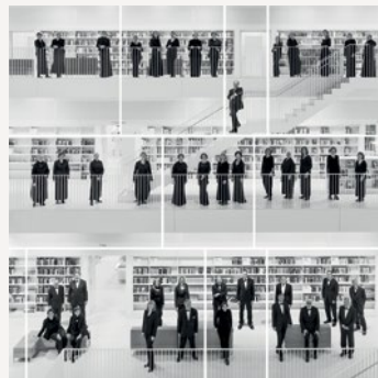
Bachchor Stuttgart

»Sing along« ist der englische Ausdruck für Mitsingen: Was Helmuth Rilling in seinen legendären Kantatengottesdiensten unternahm, gab es in ähnlicher Weise in Holland, den USA und England. Die Idee ist, vielen Menschen die Gelegenheit zum Mitsingen großer oratorischer Werke zu geben. So funktioniert's: Ein professionelles Orchester, Solisten und Dirigent stehen bereit, Sie bringen einen Klavierauszug mit und singen die Chorsätze. Man könnte dies auch »oratorisch-sinfonische Hausmusik« nennen.