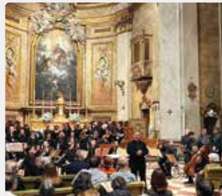
Handel Oratorio Society

Christi Auferstehung kann gar nicht fröhlich und festlich genug gefeiert werden. Eine außergewöhnliche Kantate von Johann Sebastian Bach erklingt im Gottesdienst am Ostermorgen: »Jauchzet Gott in allen Landen« ist für die seltene Besetzung Solosopran und Trompete geschrieben und verlangt von beiden Partien ein immenses Maß an Spielfreude und Virtuosität. Das Lob Gottes und der Dank für seine Güte stehen im Zentrum der Kantate, die in einem brillanten Finale gipfelt. Alleluja!